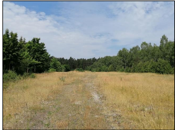
Abb. 4 Beispiel befestigte Freiflächen Eichhorst; Stand 06/2021.

Weiterführende Informationen können Sie bei Bedarf unter unten angegebener Adresse erhalten.