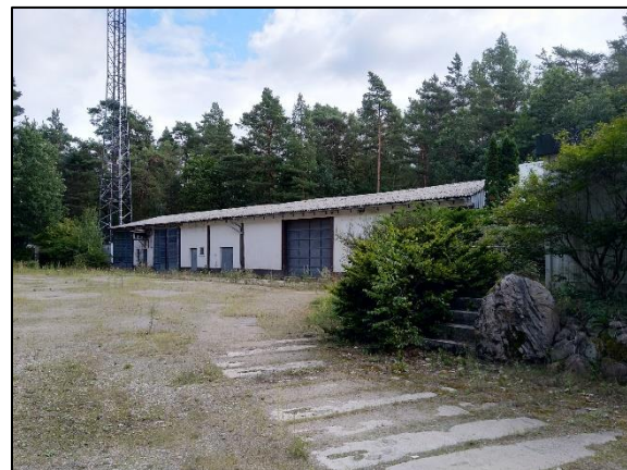
Abb. 2 Kühlhallen und befestigte Freiflächen Eichhorst; Stand 08/2021.