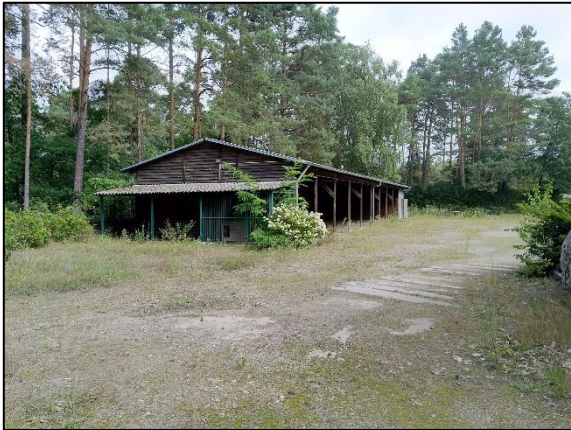
Abb. 3 Schleppdach mit Zwinger und befestigte Freiflächen Eichhorst; Stand 08/2021.