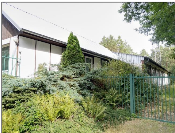
Abb. 1 Büro- und Verwaltungsgebäude Eichhorst; Stand 08/2021.

Mit der Untersuchung artenschutzrechtlicher Belange und der Erarbeitung eines mit der Unteren Naturschutzbehörde abgestimmten Artenschutzkonzeptes für den Bereich der Abriss- und Entsiegelungsobjekte und -flächen wurde die Maßnahmenumsetzung 2023 aufgenommen. Abriss und Entsiegelung sind ab Herbst 2024 geplant. Alle Arbeiten werden in enger Abstimmung mit dem Büro für die Ökologische Baubegleitung ausgeführt.