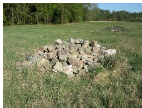
Abb. 3: Feldsteine am 30.04.19

Weiterführende Informationen können Sie bei Bedarf unter unten angegebener Adresse erhalten.