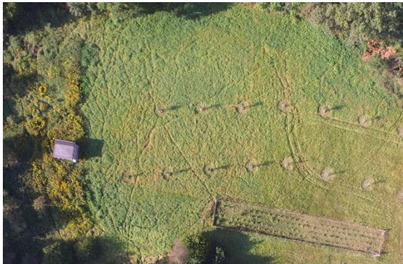
Abb. 1: Hecken / Streuobstbäume am 18.09.17

Auf den Flächen eines ehemaligen Kombinats (KIM) befanden sich mehrere Stall- und Wirtschaftsgebäude, die seit geraumer Zeit nicht mehr genutzt wurden. Das bewirtschaftete Grünland war von Landriedgras durchsetzt. Ein ehemaliger Karpfenteich hatte einen Zufluss von der Ragöse. Angrenzend gibt es Waldbeständen aus Kiefernforst und Buchen-Bruchwald.