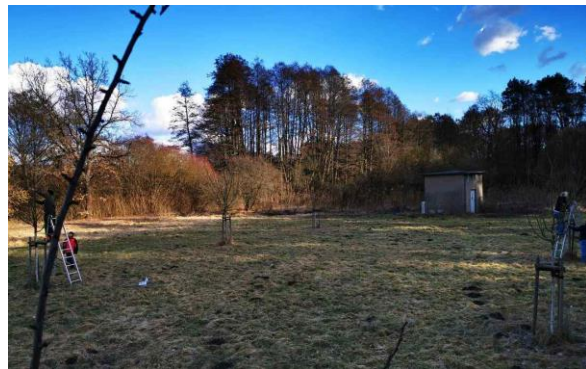
Abb. 2: Baumschnittkurs mit Anwohnern März 2021