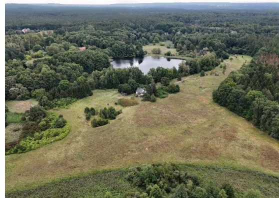
Abb. 3: Gebiet am 21.08.24

Weiterführende Informationen können Sie bei Bedarf unter unten angegebener Adresse erhalten.