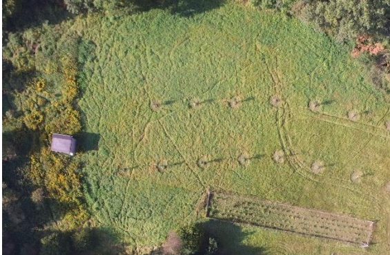
Abb. 1: Hecken / Streuobstbäume Sept. 2017

Auf den Flächen eines ehemaligen Kombinats (KIM) befanden sich mehrere Stall- und Wirtschaftsgebäude, die seit geraumer Zeit nicht mehr genutzt wurden. Das bewirtschaftete Grünland war von Landriedgras durchsetzt. Ein ehemaliger Karpfenteich hatte einen Zufluss von der Ragöse. Angrenzend gibt es Waldbeständen aus Kiefernforst und Buchen-Bruchwald.