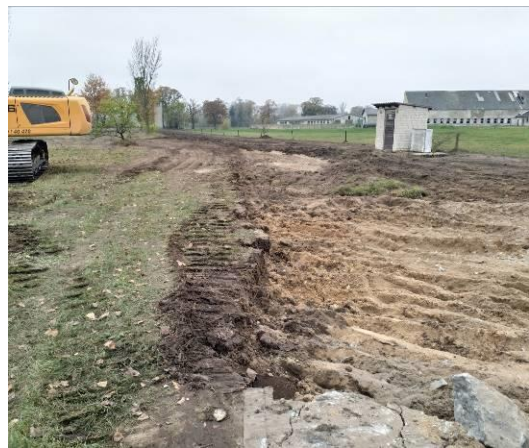
Abb. 1-6: Abbruch- und Entsiegelungsobjekte, vorher / nachher

Weiterführende Informationen können Sie bei Bedarf unter unten angegebener Adresse erhalten.