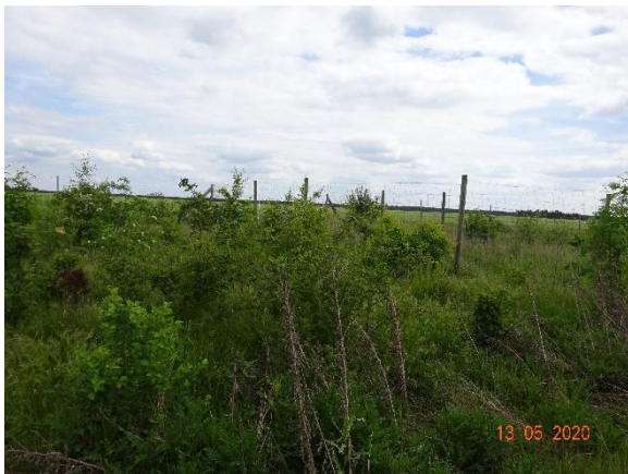
Breite Heckenpflanzung an Grundstücksgrenze