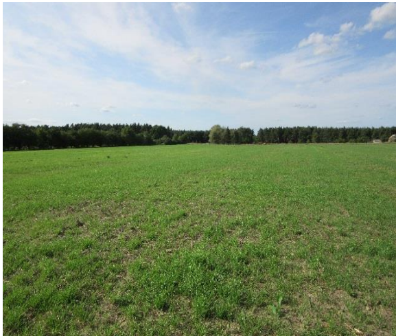
Fläche vor der Umsetzung