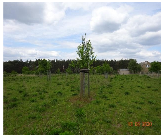
Extensives Grünland mit Hochstammpflanzungen