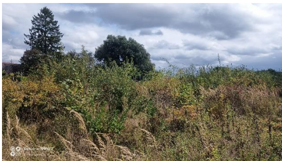
Breite Heckenpflanzung an Grundstücksgrenze 2020