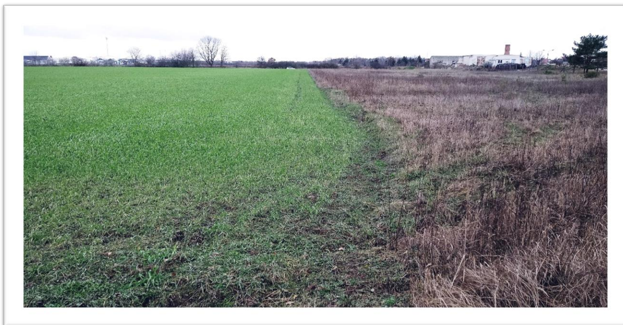
Ausgangszustand Plangebiet mit Intensivacker und Ackerbrache (im Hintergrund Gehölze an der Lapine)