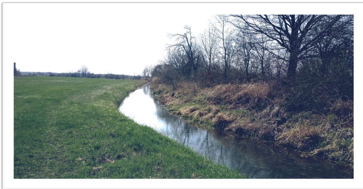
Ausgangszustand Lapine und linkes Gewässerufer (auf der rechten Seite wurden bereits Gehölzpflanzungen umgesetzt)