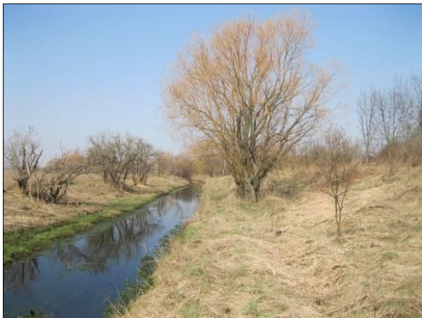
Entlang der Hangkante verläuft der Mühlberger Graben