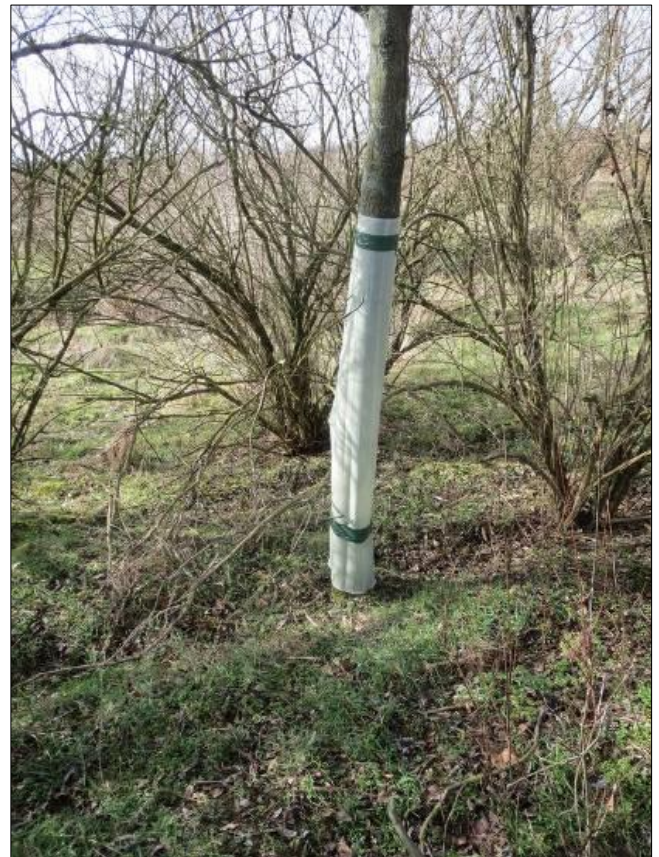
Schutz gebietsheimischer Gehölze