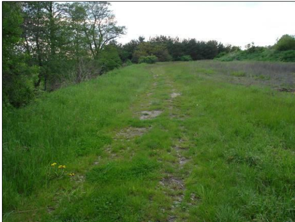
Blick auf die östliche Fläche