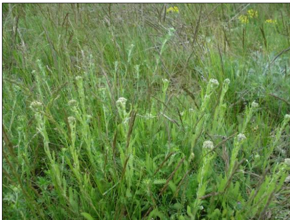
Die Feinblättrige Schafgarbe ( Achillea setacea )

Weiterführende Informationen können Sie bei Bedarf unter unten angegebener Adresse erhalten.