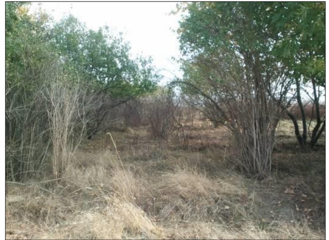
Gewünschter Gehölzverbiss durch Bentheimer Landschaft