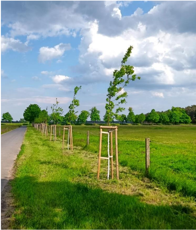
Baumreihe entlang landwirtschaftlichen Weg in Bernsdorf