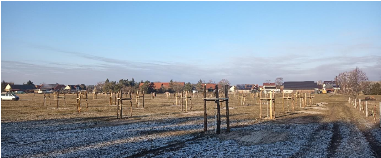
Die zweite Streuobstwiese in Jeßnigk (Pflanzung im November/Dezember 2023)