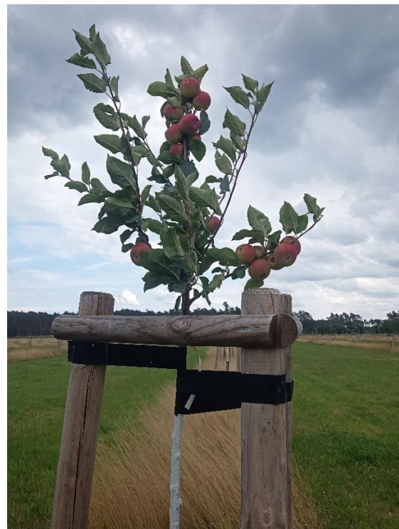
Mahd mit wechselnden Altgrasstreifen

Weiterführende Informationen können Sie bei Bedarf unter unten angegebener Adresse erhalten.