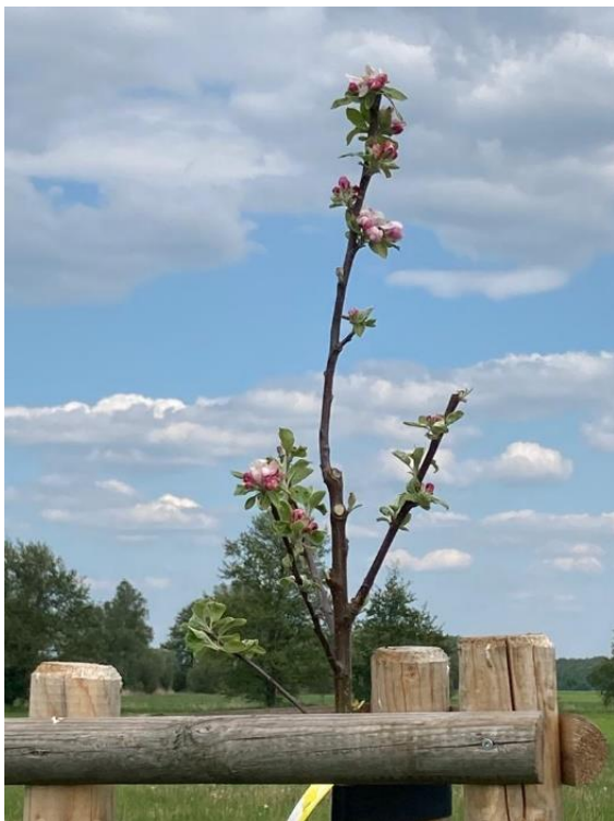
Erster Austrieb im Frühjahr 2023