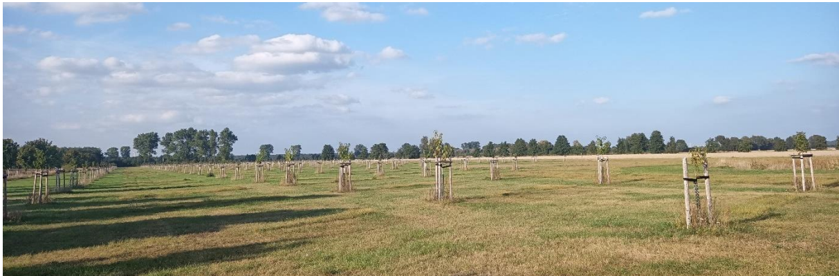
Streuobstwiese Grassau am überregionalen Radweg (Pflanzung 2022)