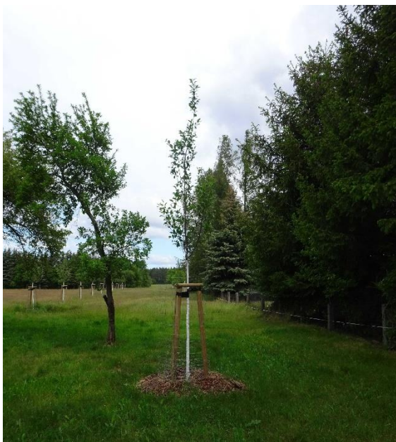
Blick auf die Streuobstwiese