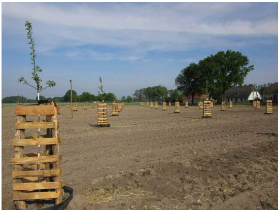
Abb. 3: Streuobst-Pflanzung Mai 2020