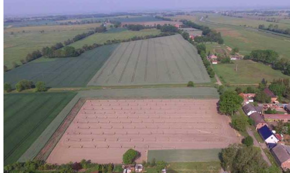
Abb. 2: Luftbild 20.05.19