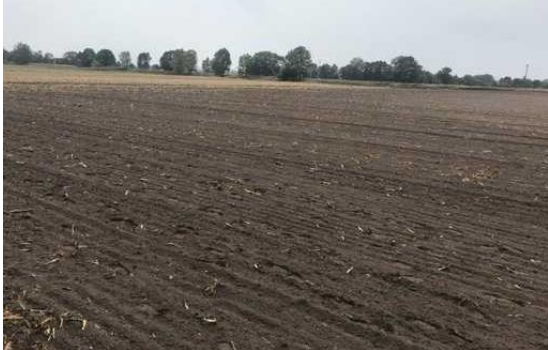
Abb. 1: Ausgangszustand 2018