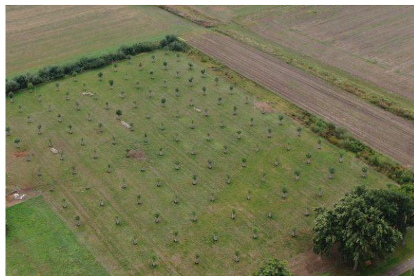
Abb. 4: Luftbild 13.09.2022