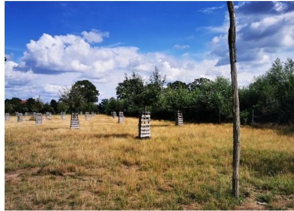
Abb. 4: Pflanzung 25.07.2023