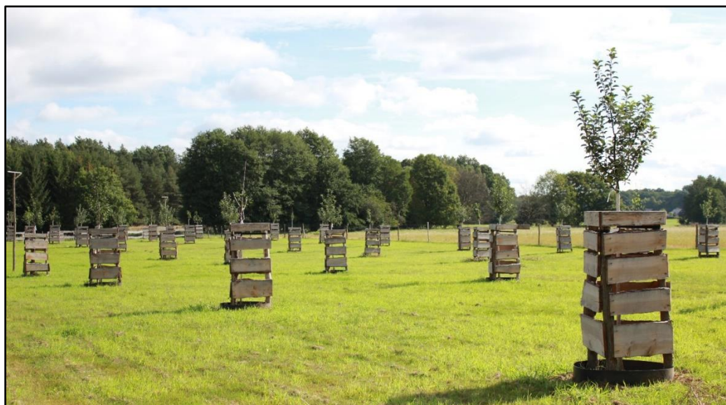
Streuobstwiese I. BA September 2015

Im Winter 2015/2016 wurde der II. Bauabschnitt mit ca. 200 Hochstämmen realisiert. Im Winter 2016/2017 erfolgte eine weitere Heckenpflanzung von ca. 8.500m 2 . Die Entwicklungspflege wurde im Jahr 2020 abgeschlossen.