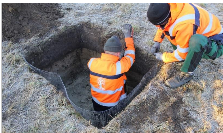
Verankerung des Schutzkorbes gegen Wühlmäuse

Die Streuobstwiese sowie die Hecke wurden auf einem privaten Acker im Herbst/Winter 2014/15 gepflanzt und über einen Grundbucheintrag dauerhaft gesichert. Die hier neu angelegten Streuobstwiesen erfüllen damit auch eine Pufferfunktion zur Ortslage. Es kamen vorwiegend alte und regional verwendete Apfel-, Birnen- und Pflaumensorten zum Einsatz. Diese wurden aus einer Nauener Baumschule bezogen, sodass sie auch an den mageren Standort angepasst sind. Die Grünlandpflege soll später durch Schafe oder Pferde erfolgen. Als eine besondere Herausforderung galt der Schutz vor Wühlmäusen, so dass mit Drahtkörben im Wurzelbereich gearbeitet worden ist.