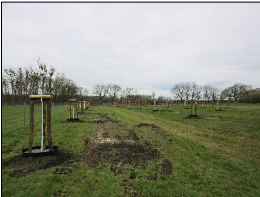
Einrichtung der Streuobstwiese in Bredow (März 2019)