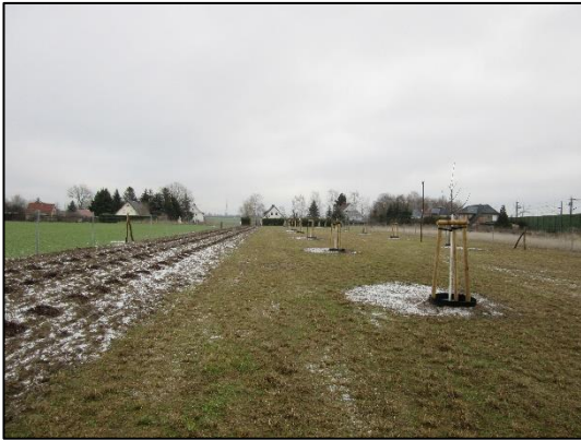
Streuobstwiese und Heckenpflanzung in Wernitz (Januar 2019).