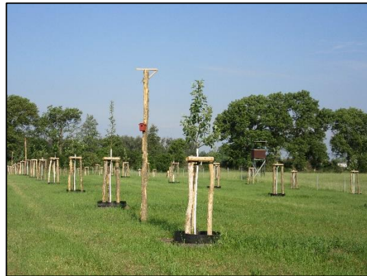
Streuobstwiese in Bredow (Juni 2019).