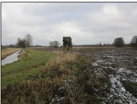
Intensivacker in Dyrotz-Luch (Januar 2019).