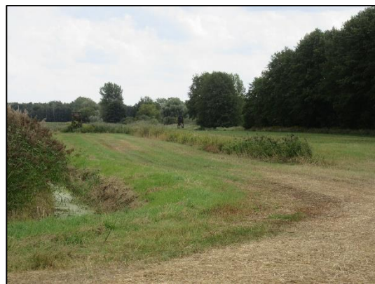
Extensivgrünland mit Altgrasstreifen im August des Einsatzjahres 2019.