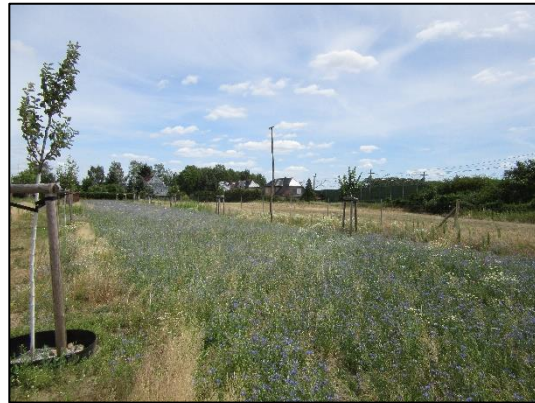
Blühstreifen und Streuobstwiese in Wernitz (Juni 2019).