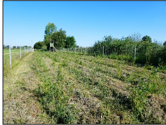
Gehölzpflanzung in Dyrotz im ersten Pflanzjahr (Juli 2020)

Weiterführende Informationen erhalten Sie bei Bedarf unter unten angegebener Adresse.