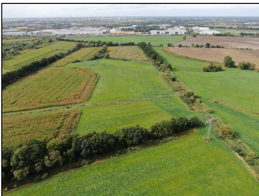
Abb. 5 Extensivgrünland und Gehölzpflanzungen Dyrotz-Luch (September 2022).