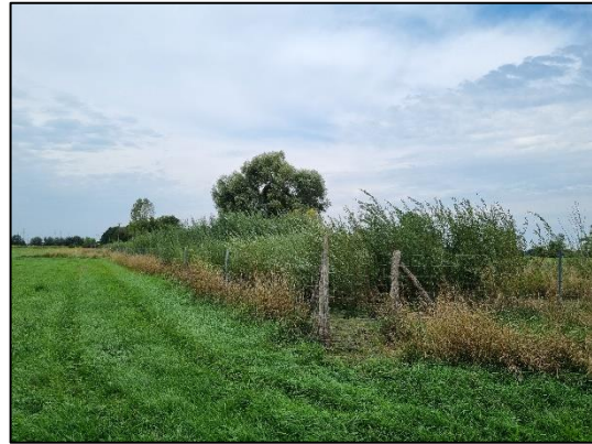
Abb. 8 Heckenkorridor in Dyrotz-Luch (September 2022)

Weiterführende Informationen erhalten Sie bei Bedarf unter unten angegebener Adresse.