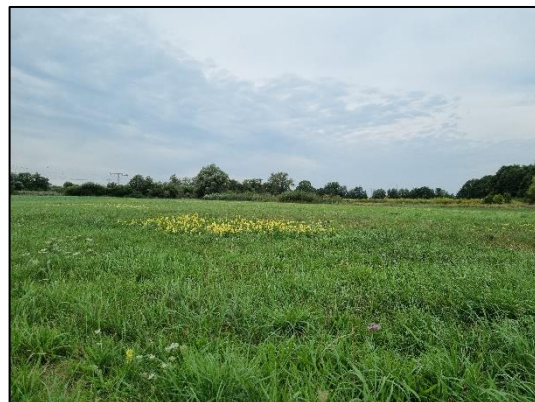
Abb. 6 Extensivgrünland in Dyrotz-Luch (September 2022).