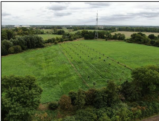
Abb. 3 Streuobstwiese in Bredow (September 2022).