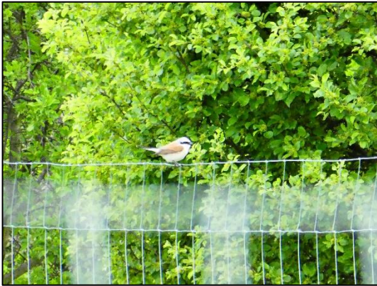
Abb. 7 Schutzzaun der Gehölzpflanzung in Dyrotz – Ansichtswarte eines Neuntöters (Mai 2020)