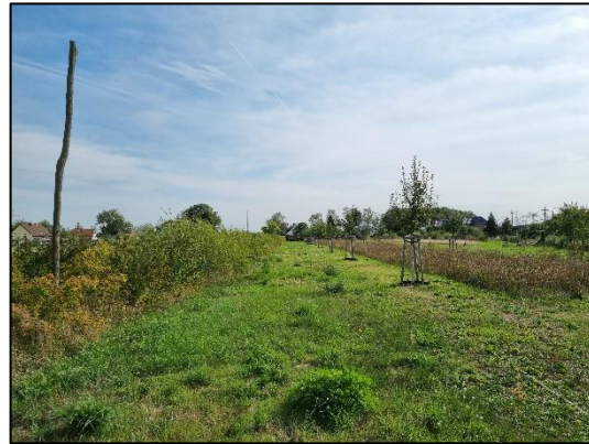
Abb. 2 Streuobstwiese mit Blühstreifen und Heckenpflanzung in Wernitz (September 2022).