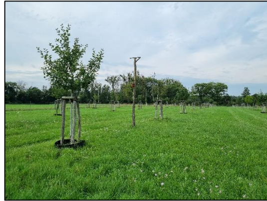
Abb. 4 Streuobstwiese in Bredow (September 2022).