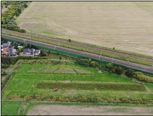
Abb. 1 Streuobstwiese und Heckenpflanzung in Wernitz (September 2022).