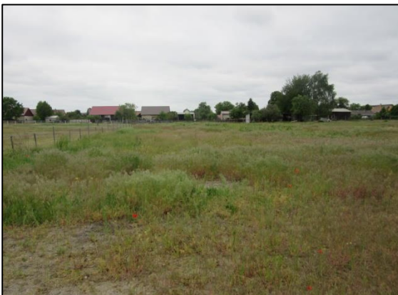
Abb. 9-10: Maßnahmenfläche im Mai 2023, (Fotos: Friederike Kunz)

Weiterführende Informationen können Sie bei Bedarf unter unten angegebener Adresse erhalten.