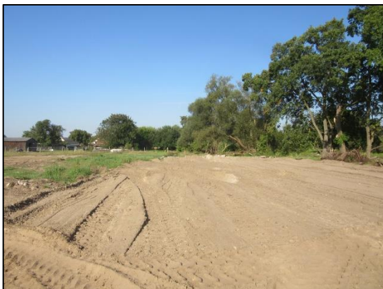
Abb. 5-8: Maßnahmenfläche im September 2021