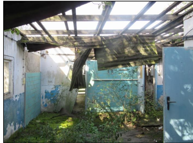
Abb. 1-4: Abbruch- und Entsiegelungsobjekte im September 2020