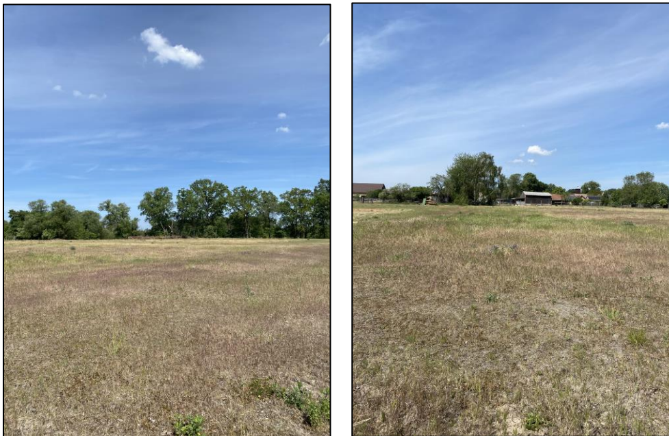
Abb. 9-10: Maßnahmenfläche im Mai 2024, (Fotos: Friederike Kunz)

Weiterführende Informationen können Sie bei Bedarf unter unten angegebener Adresse erhalten.