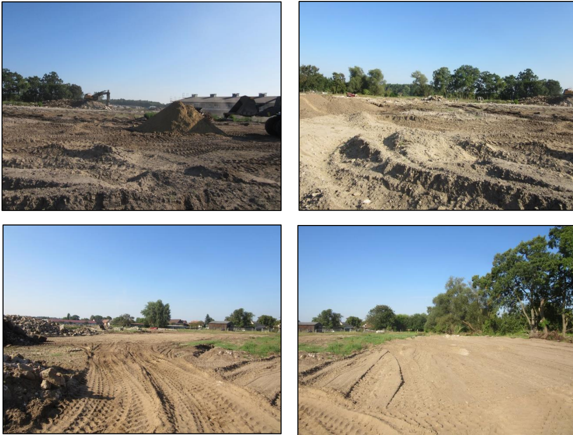
Abb. 5-8: Maßnahmenfläche im September 2021, (Fotos: Friederike Kunz)