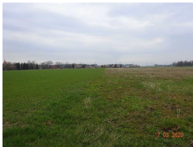
Acker- und Ackerbrache in ausgeräumter Landschaft