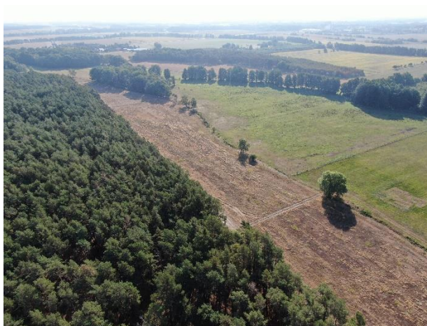
Blick von oben auf Kiefernforst und südlich angrenzende Acker- und Grünlandflächen