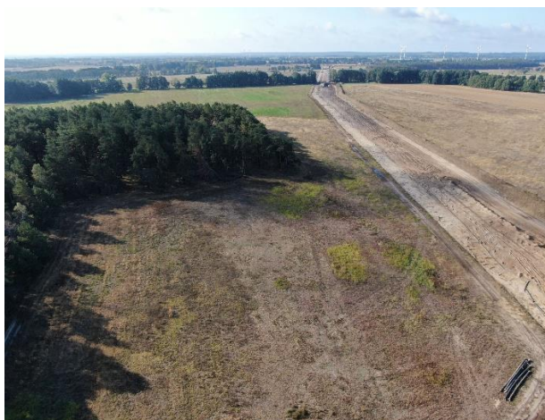
Blick von oben auf Ackerflächen, EUGAL-Trasse und Kiefernforst