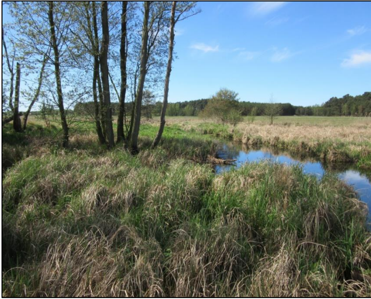
Abb.5: Maßnahmenbereich Leibchel (2019)