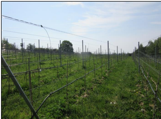
Abb. 2: Weinberg (April 2020)