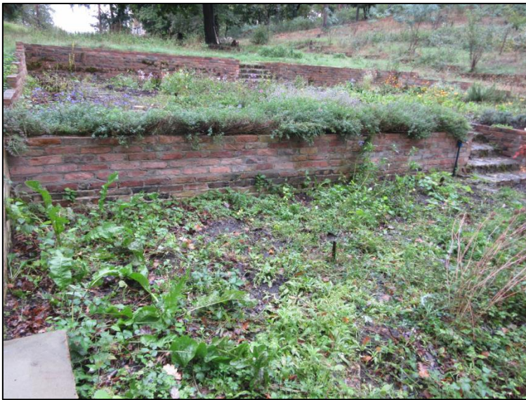
Abb. 1: Entwicklung eines Kräutergartens am Gräbendorfer Weinberg (2020, Foto: F. Kunz)

Weiterführende Informationen können Sie bei Bedarf unter unten angegebener Adresse erhalten.