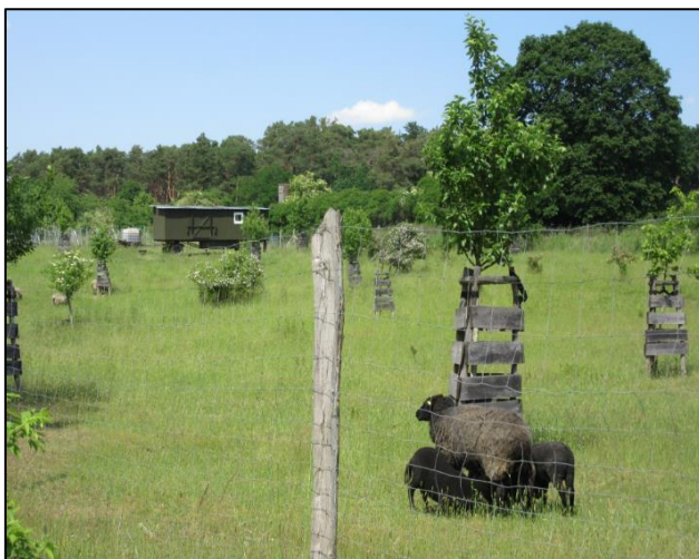
Abb. 3: Streuobstwiese mit Schafbeweidung im Maßnahmenbereich Gräbendorf Weinberg (Sommer 2019)