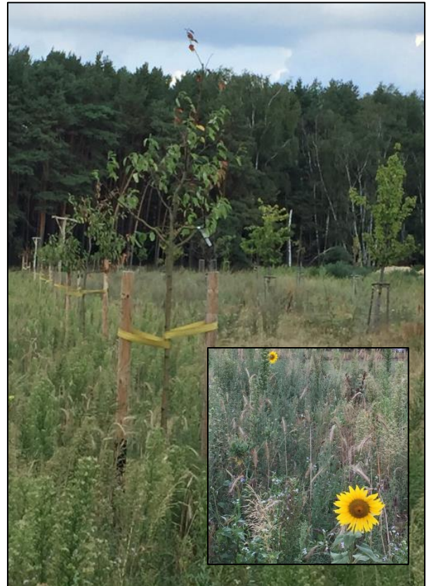
Abb. 4: Streuobstbestände im Maßnahmenbereich Klein Eichholz mit Neuanlage einer Brandenburger Bienenweide (Sommer 2019)