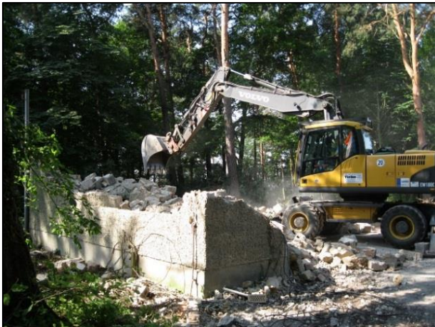
Abb. 1: Abriss und Entsiegelung im Maßnahmenbereich Weinberg Gräbendorf