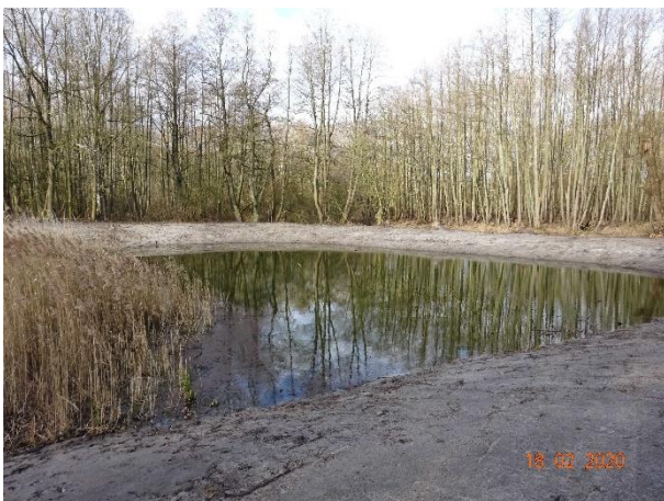
Das Gewässer kurz nach Abschluss der Arbeiten

Weiterführende Informationen können Sie bei Bedarf unter unten angegebener Adresse erhalten.