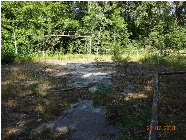
Versiegelte Tanzfläche vor der Renaturierung