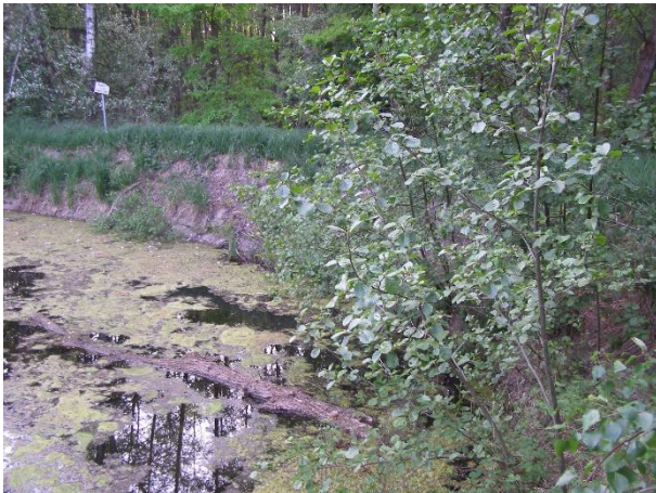
Das ehemalige Waldbad vor der Renaturierung