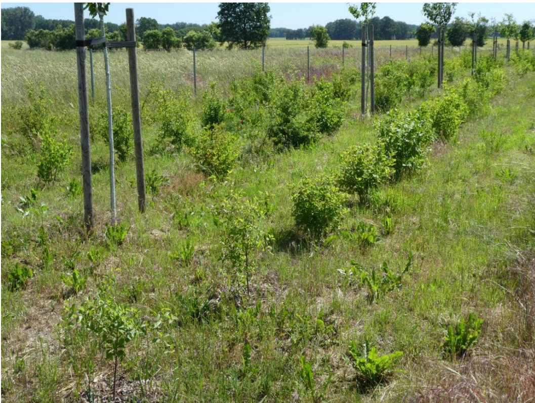
Abb. 2: Hecke im Sommer 2018

Weiterführende Informationen können Sie bei Bedarf unter unten angegebener Adresse erhalten.