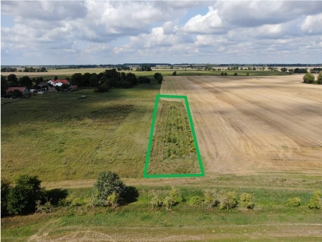
Abb. 1: Hecke Charlottenhof aus der Luft im Sommer 2019