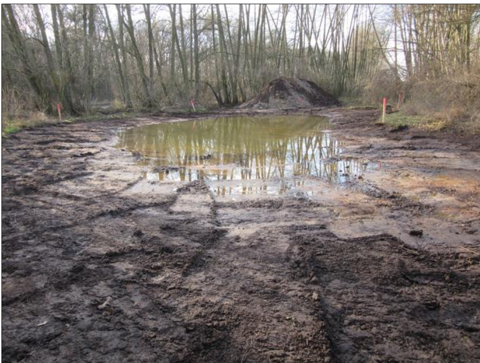
Abb. 3: Kleingewässer 1 nach der Anlage; erkennbar ist die sehr flache Ausformung