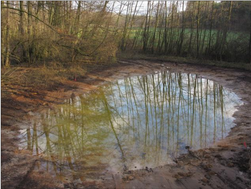
Abb. 2: Das frisch fertiggestellte Kleingewässer 2 im Dezember 2017