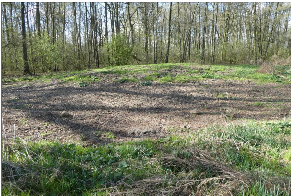
Abb. 4: Rohbodenhügel im April 2019

Weiterführende Informationen können Sie bei Bedarf unter unten angegebener Adresse erhalten.