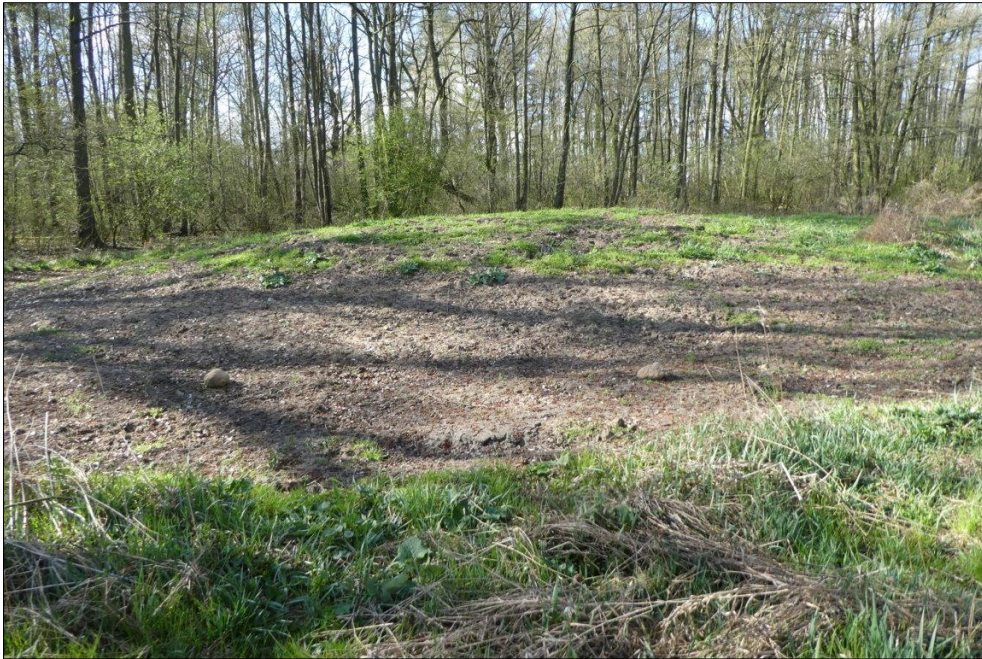
Abb. 4: Rohbodenhügel im April 2019

Weiterführende Informationen können Sie bei Bedarf unter unten angegebener Adresse erhalten.