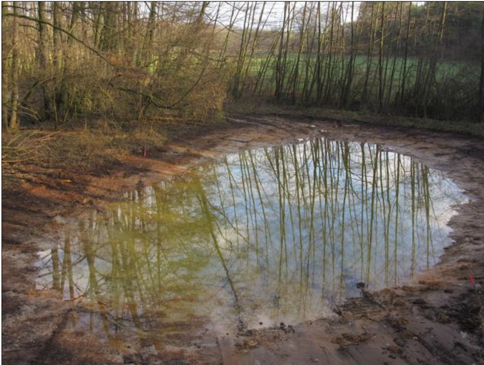
Abb. 2: Das frisch fertiggestellte Kleingewässer 2 im Dezember 2017