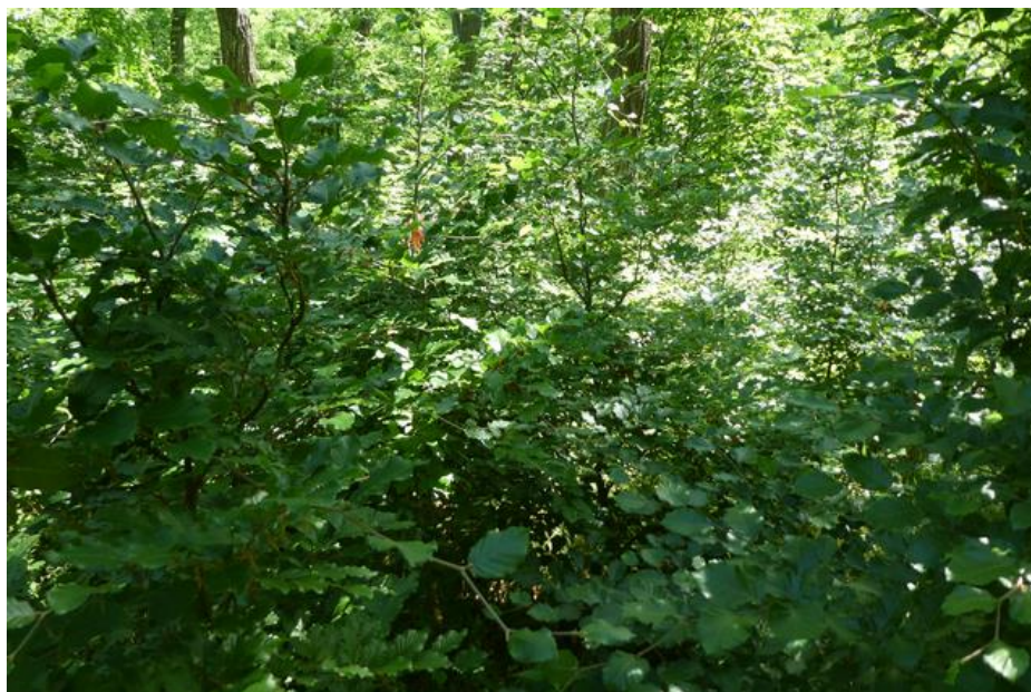
Abb. 3: Juni 2018 – Die Laubgehölze haben sich in einigen Bereichen bereits vollständig durchgesetzt.

Im Jahr 2020 wurde ein zusätzlicher Pflegegang durchgeführt, um den Maßnahmenenerfolg abzusichern.