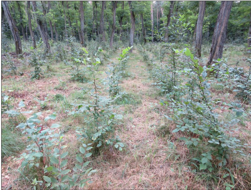
Abb. 1: Pflanzung im Sommer 2015. Ältere Robinien bilden den Schirm, der ca. zehn Jahre nach der Pflanzung entfernt werden soll. Klar erkennbar die Reihen der neu gepflanzten Laubbäume.