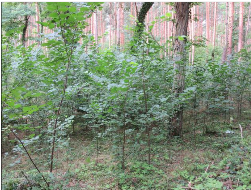
Abb. 2: Sommer 2016: Bereits deutlich erkennbare Dominanz der neuen Laubgehölzpflanzung