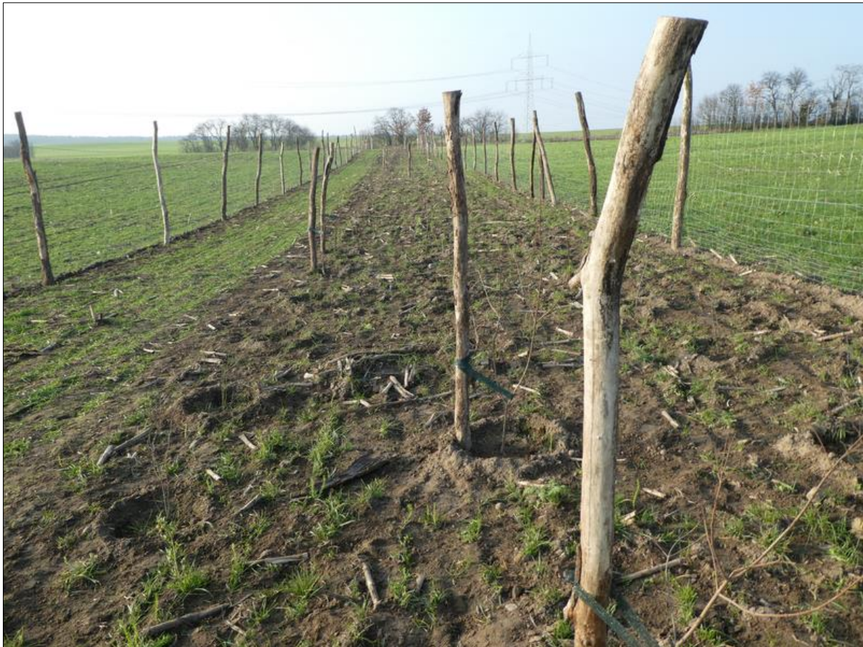
Abb. 1: Hecke in Jänickendorf unmittelbar nach der Pflanzung im Dezember 2020

Die drei Hecken in Neuendorf im Sande wurden im November 2019, die in Jänickendorf im Dezember 2020 gepflanzt.