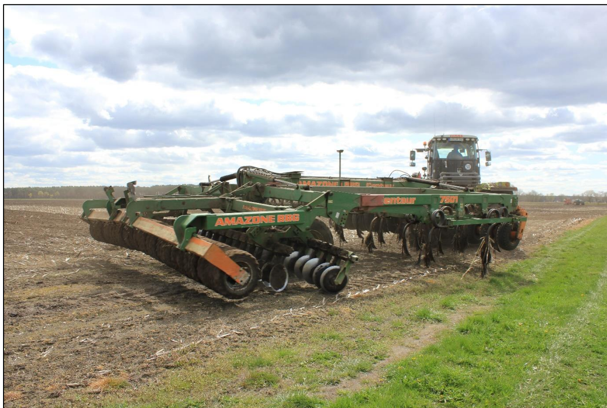
Abb. 3: Saatbettvorbereitung mit Grubber/ Scheibenegge/Walze (26.04.2021,)

Weiterführende Informationen können Sie bei Bedarf unter unten angegebener Adresse erhalten.