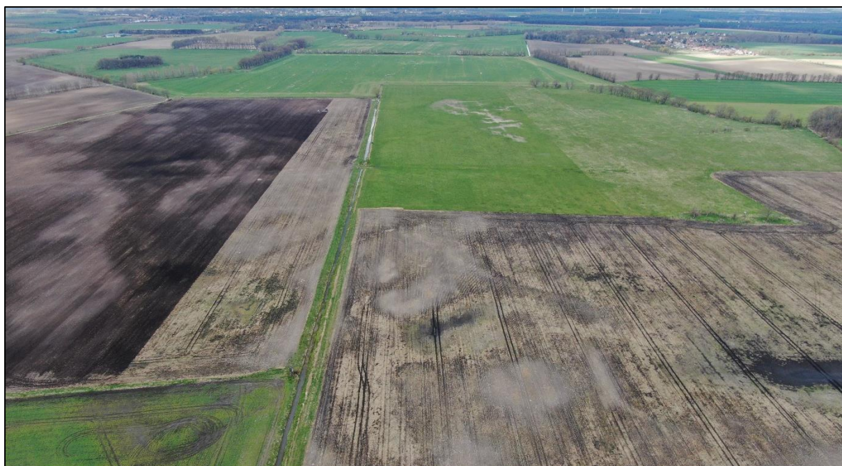
Abb. 1: Bürgerwiesen, Luftbild 26.04.2021 ; bereits bestehendes Grünland im rechten oberen Teil, Saatbettvorbereitung im linken Teil; noch vorzubereitendes Saatbett/Maisstoppeln im rechten unteren Teil des Bildes

Auf den Flächen wird ein maximal möglicher Wintereinstau mit dem Ziel der Blänkenbildung in tiefergelegenen Flächenbereichen angestrebt.