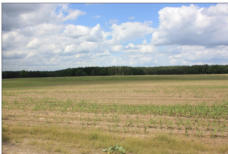
Abb. 2: Maßnahmenfläche 2, Zustand vor Maßnahmenbeginn

Für den Pool wurde eine Planung zur Erhebung des Ausgangszustandes und Entwicklung von Maßnahmensvorschlägen beauftragt und mit der Unteren Naturschutzbehörde abgestimmt.