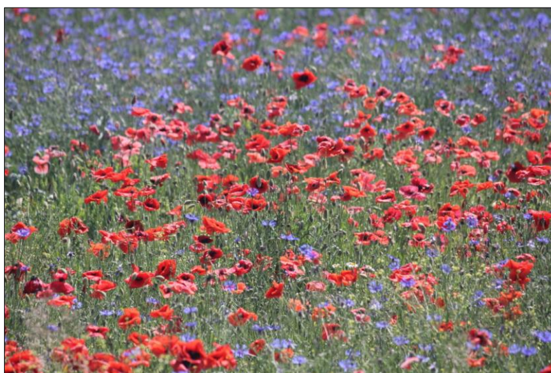
Abb. 4 und 5: Erste Blüte im Juni 2019

Weiterführende Informationen können Sie bei Bedarf unter unten angegebener Adresse erhalten.