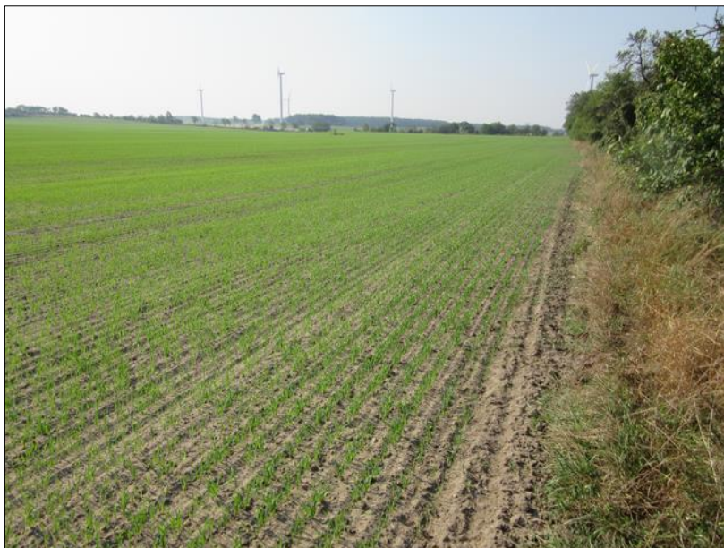
Abb. 1: Maßnahmenfläche 1 am Ortsrand Glienicke, Zustand vor Maßnahmenbeginn

In der Feldflur westlich von Glienicke ergab sich durch diesen Flächenerwerb die Möglichkeit, zwischen intensiv genutzten Landwirtschaftsflächen zwei große Grünlandbereiche zu etablieren. Damit soll neben den allgemein positiven naturschutzfachlichen Wirkungen dieses Maßnahmentyps speziell auch eine Habitatverbesserung für Feldlerchen erreicht werden. Diese finden in früh und dicht wachsenden Kulturen zu wenige oder keine geeigneten Brutflächen.