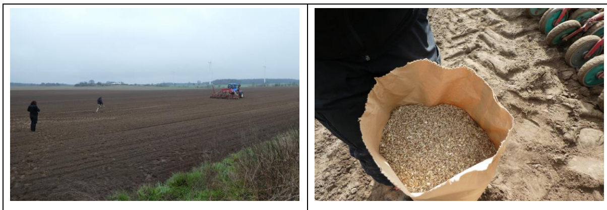
Abb. 3: Aussaat mit Regiosaatgut durch die Agrar GbR Herzberg, begleitet durch Experten der Firma nagolare (März 2019)