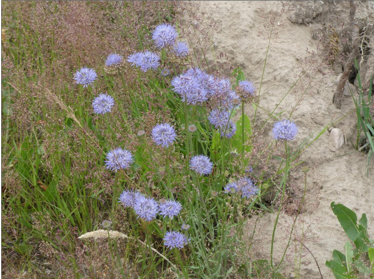
Abb. 1: Trockenrasenartige Vegetationsausprägung im Südteil des Flächenpools mit Schaf-Skabiose

Seit Ende 2012 wird das Grünland im Flächenpool mit Schafen beweidet, nach Empfehlungen der botanischen Erfolgskontrolle sollte sich auf diese Weise die Artenausstattung und der naturschutzfachliche Wert der Flächen weiter verbessern lassen. Systematische Auswertungen der Beweidungserfolge aus dem Jahre 2013 zeigen, dass sich die Flächen weiter in die gewünschte Richtung entwickeln. Laufende Abstimmungen und Anpassung der Nutzung werden in diesem Sinne weiter durchgeführt. In den Jahren 2019 bis 2021 zeigte sich eine weiter positive Entwicklung durch die Beweidung. 2019 wurden bei einer Begehung mit der UNB und einem Biologen zahlreiche naturschutzfachlich wertvolle Pflanzen- und Insektenarten festgestellt.