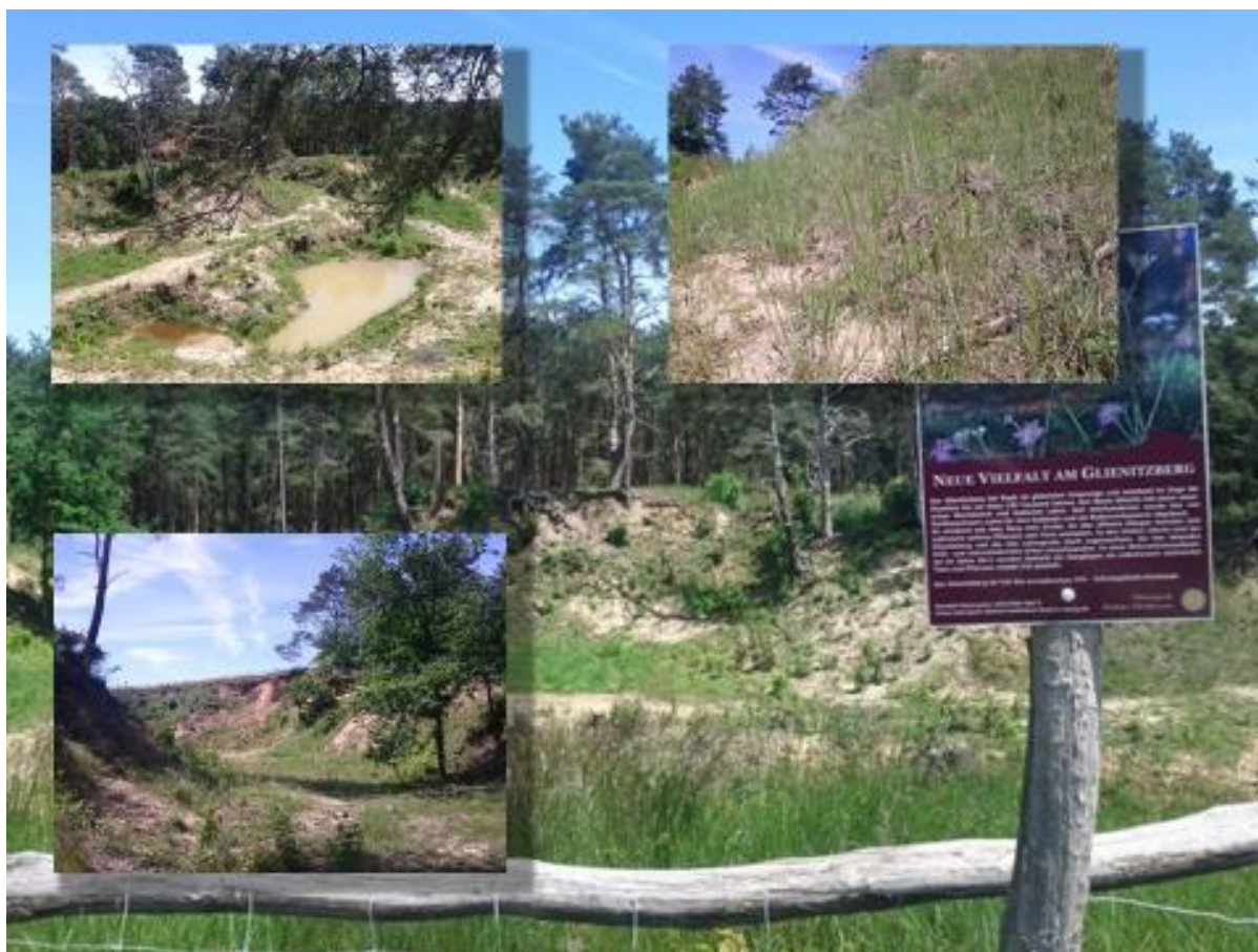
Abb. 1: Eindrücke vom Glienitzberg

Die Beweidung läuft seit dem Sommer 2013, die bisherigen Ergebnisse wurden von verschiedenen Experten einhellig als gut beurteilt.