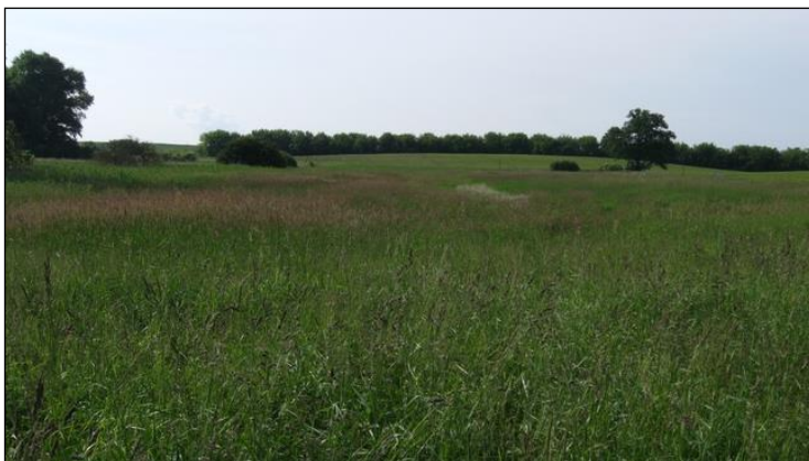
Blick in den Wiesenbereich

2016 wurde die Pflegenutzung auf Schafbeweidung umgestellt. Seitdem zeigt sich eine naturschutzfachlich positive Entwicklung des Wiesenbereiches.