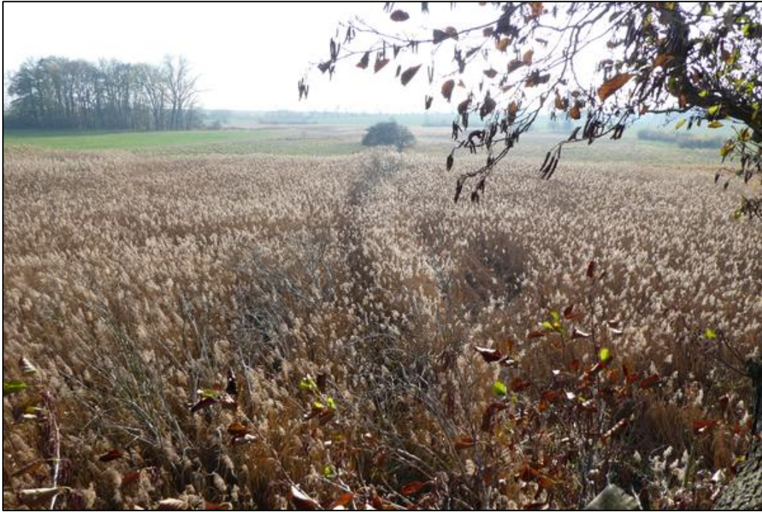
Blick in eine Schilfbereich (Vordergrund) und durch Beweidung kürzer gehaltenes Grünland (Hintergrund) am Teufelstein, Herbst 2018.

Weiterführende Informationen können Sie bei Bedarf unter unten angegebener Adresse erhalten.