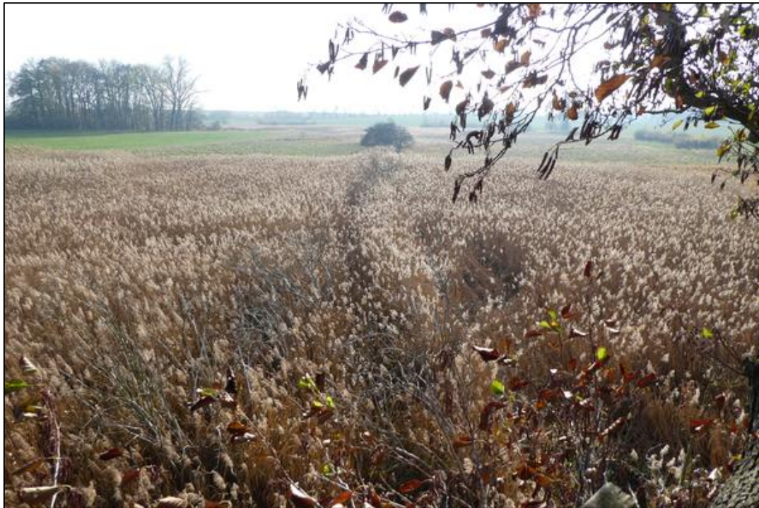
Blick in eine Schilfbereich (Vordergrund) und durch Beweidung kürzer gehaltenes Grünland (Hintergrund) am Teufelstein, Herbst 2018.