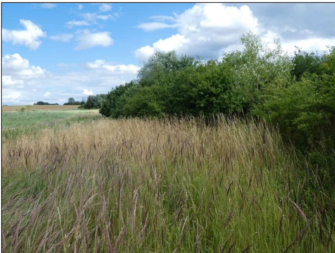
Blick auf eine der Pflanzungen mit davor liegendem Grünland unterschiedlicher Ausprägungen, Sommer 2013.

Weiterführende Informationen können Sie bei Bedarf unter unten angegebener Adresse erhalten.