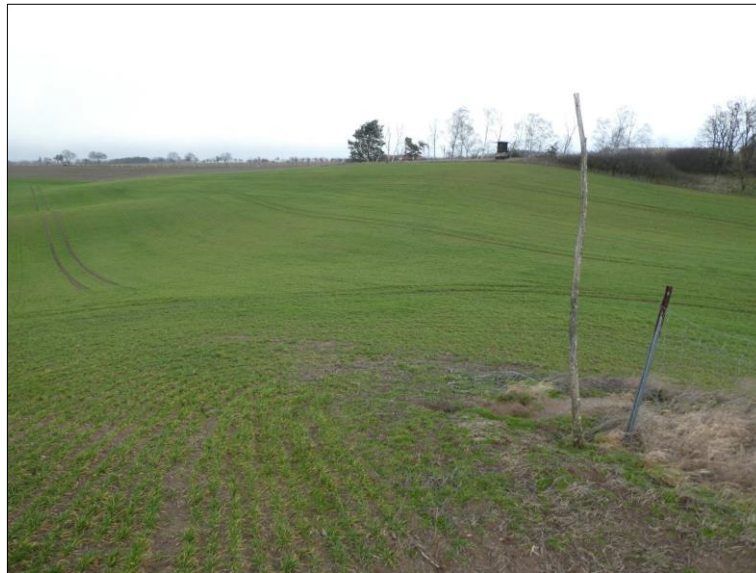
Abb. 2: Blick auf die Fläche von der Anhöhe im Osten, Blickrichtung Nordwesten, (Fotos: M. Szaramowicz)

Die Umnutzung der Poolflächen beginnt im Herbst 2020 durch Änderung der Nutzung. Pflanzmaßnahmen und die Ersteinrichtung des Grünlandes sind für 2021 geplant.