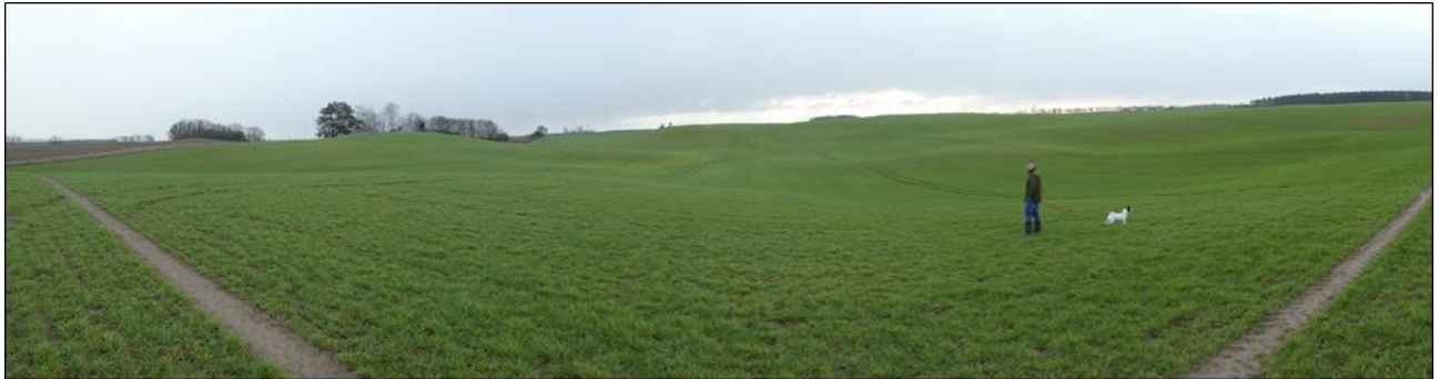
Abb. 1: Panorama der Maßnahmenfläche von Westen

In der Feldflur nordöstlich des Hohenjesarscher Sees werden in diesem Flächenpool extensives Grünland und, die Poolfläche einrahmend, breite Feldhecken etabliert. Die Fläche ist stark reliefiert und umgeben von weiträumiger Ackernutzung mit wenigen Gehölzinseln. Inmitten der Poolfläche selber sollen ein bis zwei kleinere Feldgehölzgruppen angelegt werden.