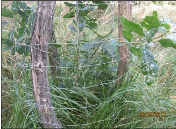
Schutzgitter für Naturverjüngung