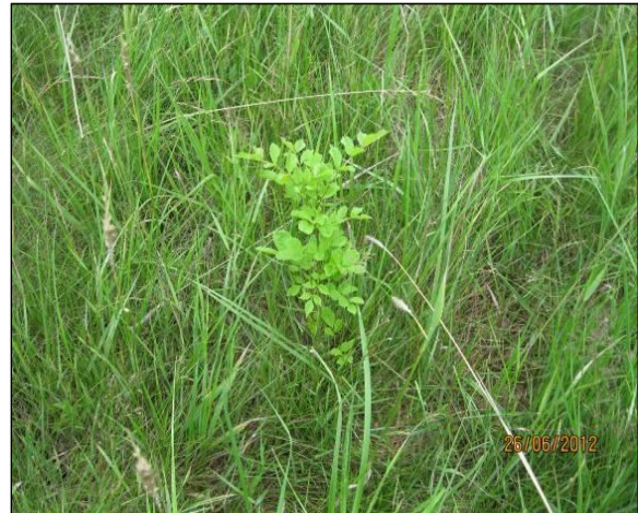
Naturverjüngung Flatter-Ulme ( Ulmus laevis )