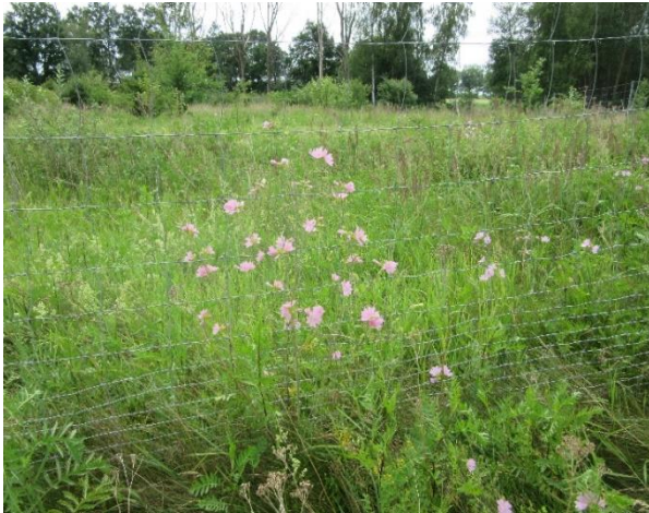
Einzäunung nach Pappelfällung