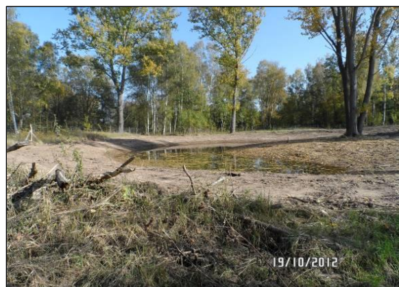
Amphibiengewässer kurz nach Fertigstellung..