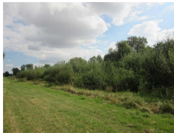
Zaunrückbau an üppiger Pflanzung nach 5 Jahren