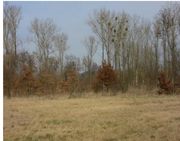
Gehölzpflanzung auf Grünland