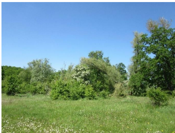
Sukzessionsstadium mit viel Weißdorn