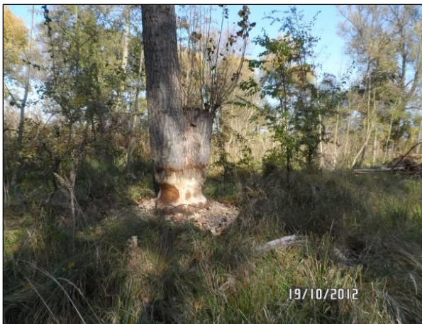
Der Biber fällt die restlichen Hybridpappeln selbst