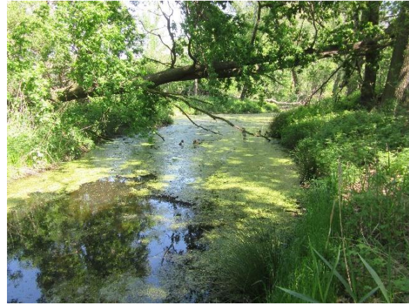
und 3 Jahre später