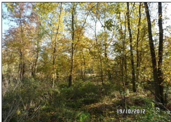
Bestand mit Flatter-Ulmen