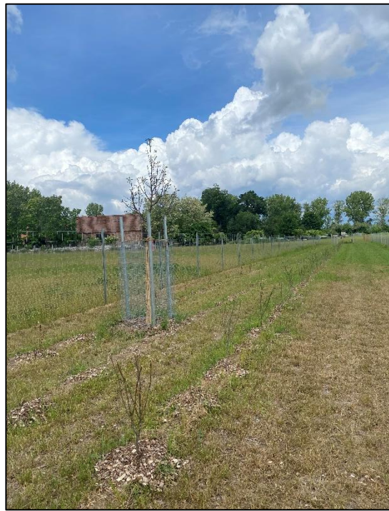
Abb. 1. u. 2.: Leistungsfeststellung im Frühjahr 2025

Weiterführende Informationen können Sie bei Bedarf unter unten angegebener Adresse erhalten.