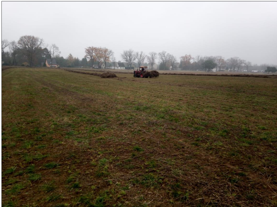
Abb. 1: Abtrag des Roggens im Herbst 2020

Die Fläche wird künftig durch einschürige Mahd mit Mahdgutentfernung gepflegt, der Mahdzeitpunkt wird der Entwicklung der Zielarten angepasst. Beweidung ist eine Option, ggf. aber erst nach Etablierung des Grünlandes.