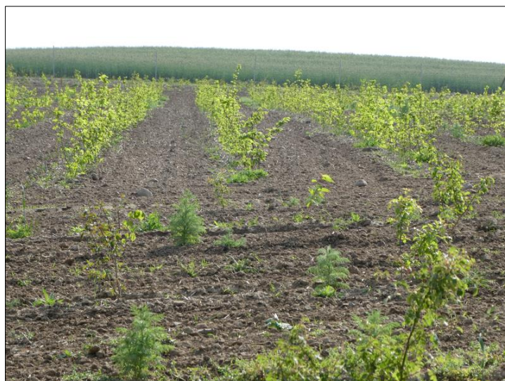
Abb. 2: Flächenzustand nach der Winterpflanzung im Mai 2021

Weiterführende Informationen können Sie bei Bedarf unter unten angegebener Adresse erhalten.