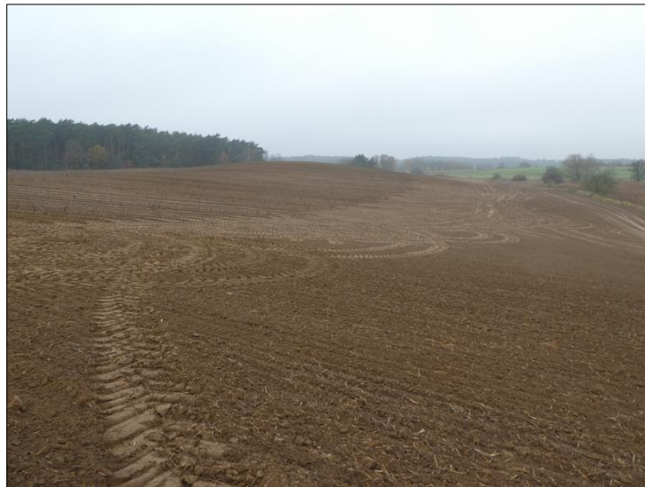
Abb. 1: Maßnahmenfläche im Vorzustand als Acker (rechts oben im Bild ist schon die begonnene Pflanzung erkennbar).

Die Pflanzmaßnahmen fanden im Winter 2020 /2021 statt, die erste Winterpflagemahd im 2021/2022.