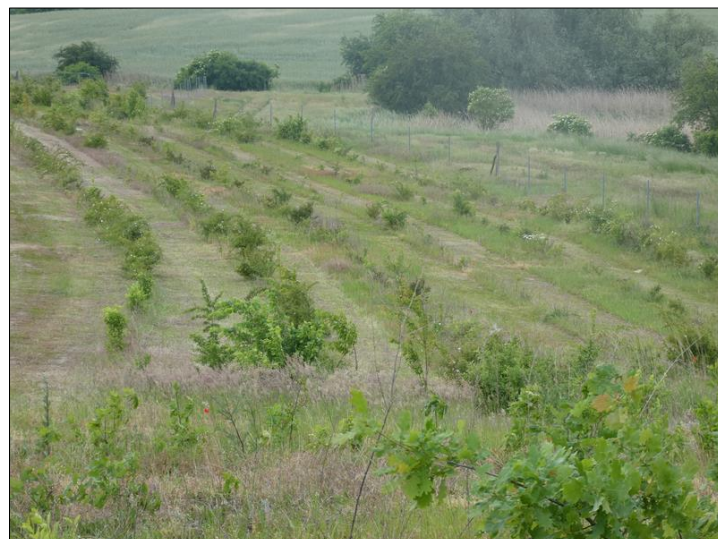
Abb. 2: Blick in einen Teil der breiten Gehölzpflanzung als Waldrand im Mai 2024

Weiterführende Informationen können Sie bei Bedarf unter unten angegebener Adresse erhalten.