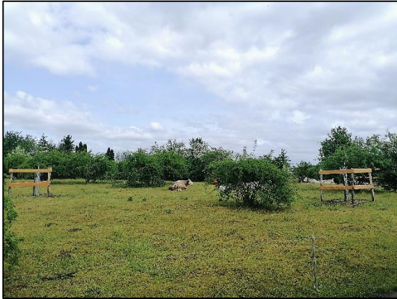
Abb. 4 Mutterkuhbeweidung im Bereich der jungen Pflanzung; Stand 05/2023.