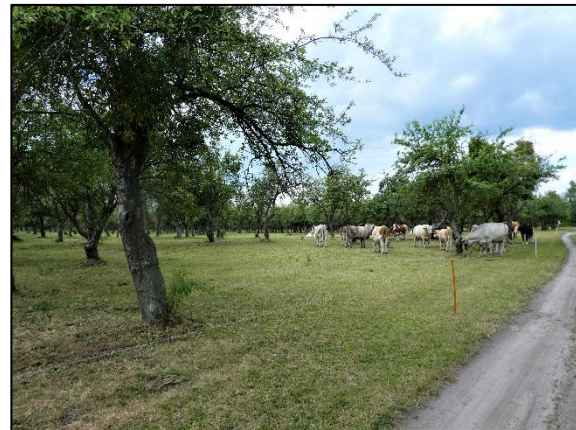
Abb. 3 Unternutzung Mutterkuhbeweidung; Stand 06/2021.