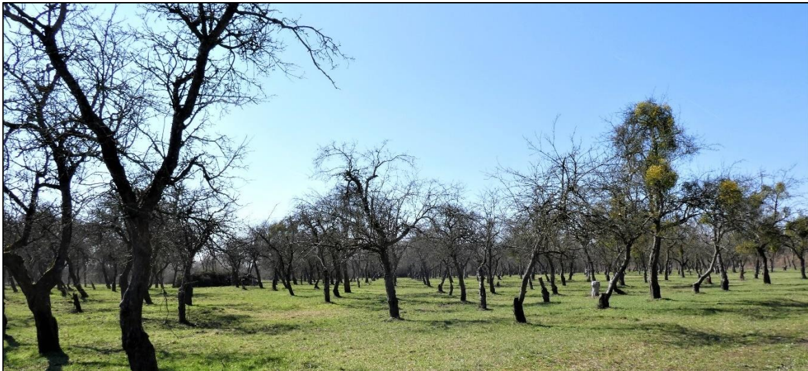
Abb. 1 Altanlage; re. im Bild – vor Mistelschnitt, li. im Bild – nach Mistelschnitt; Stand 03/2021.

Der fachgerechte Verjüngungsschnitt relativ vitaler Altbäume wurde im Winter 2020/2021 aufgenom- men und jährlich fortgesetzt. Zusätzlich wurde in diesem Zeitraum damit begonnen, den extremen Mistelbefall einzudämmen, der sowohl für die Altbäume als auch für die Neuanpflanzungen sowie für umliegende Gehölze ein Problem darstellt. Im Winter 2022/2023 wurde die angrenzende junge Streu- obstwiese vorwiegend mit Apfelbäumen alter Sorten angelegt, die den Altbaumbestand künftig er- gänzt.