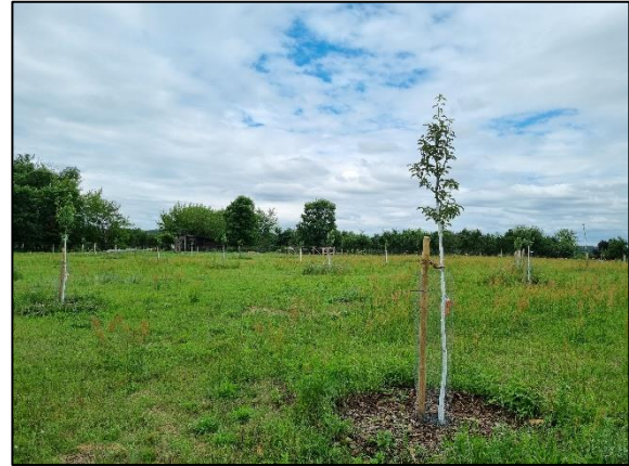
Abb. 5 Junge Streuobstpflanzung im ersten Pflegejahr; Stand 06/2023.

Weiterführende Informationen können Sie bei Bedarf unter unten angegebener Adresse erhalten.