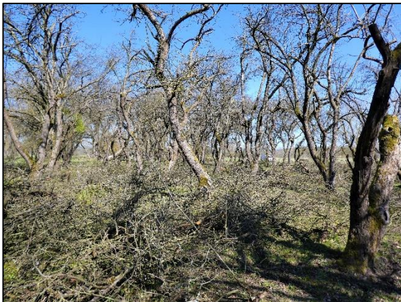
Abb. 2 Verjüngungsschnitt in Altanlage; Stand 03/2021.