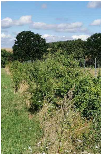
Abb. 5: Heckenwuchs 2020