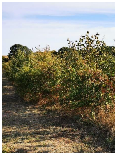
Abb.6: Hecke 06.09.2022