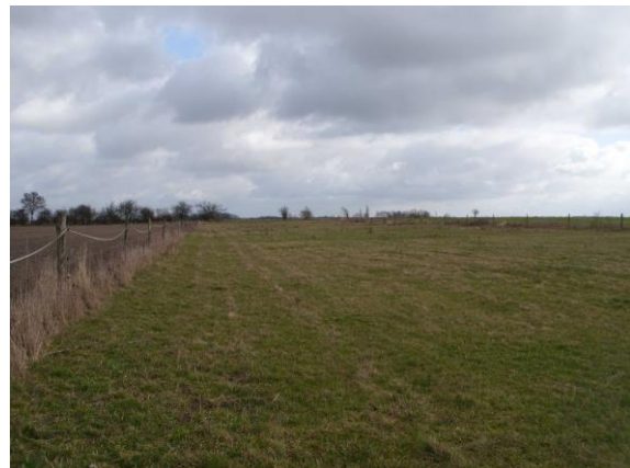
Abbildung 2: Sicht nach Ost vor der Umsetzung