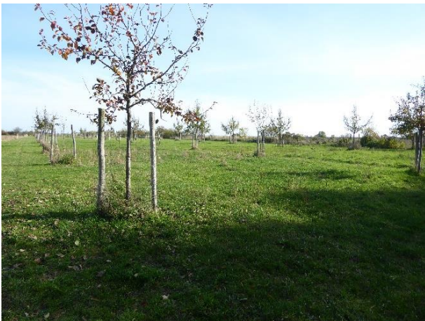
Abbildung 4: Streuobstwiese im Oktober 2022