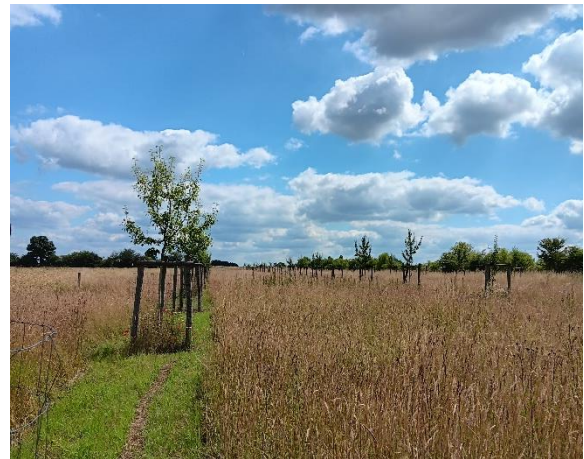
Abbildung 5: im Juni 2024