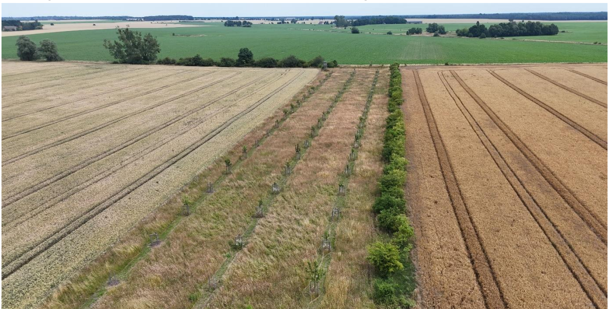
Abbildung 4: Drohnenbild 06/2024