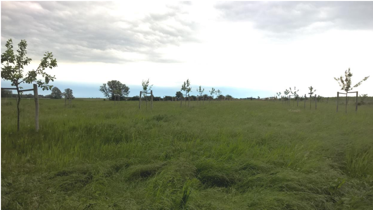
Abbildung 3: Streuobstwiese im Mai 2017