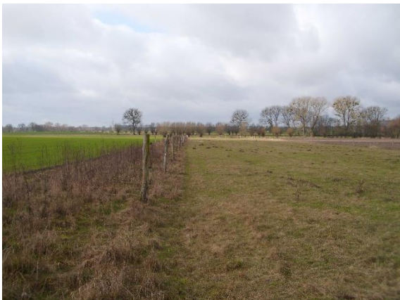
Abbildung 1: Sicht nach West vor der Umsetzung