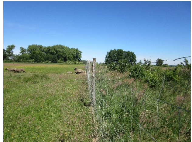
Die angrenzenden Nasswiesen werden durch Schwarzkopfschafe beweidet.