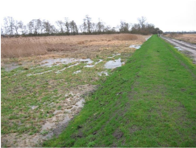
Wasserrückhalt im NSG ist möglich durch eine Verwallung im Randbereich

Im Poolgebiet lassen sich Kompensationsmaßnahmen, die Entwicklung hochwertiger Flächen im NSG und Maßnahmen zur Stabilisierung des regionalen Wasserhaushalts zu einer effektiven Naturschutzstrategie für ein großes, zusammenhängendes Gebiet verbinden. Durch den Pool können in dieses Gesamtkonzept genau die Flächen und Maßnahmen eingebracht werden, die über andere Instrumente nicht realisierbar wären. Es geht dabei v.a. um die Extensivierung landwirtschaftlicher Flächen, die Schaffung gebietstypischer Gehölzstrukturen und die Anhebung des Grundwasserstandes auch außerhalb des NSG. So kann z.B. durch die Realisierung der Poolmaßnahmen der Wegfall von Rastplätzen für Zugvögel im NSG durch – naturschutzfachlich gewollte - Sukzession aufgefangen werden. Im Ergebnis finden im Gebiet sowohl Sukzessionsprozesse als auch Landschaftspflege zur Offenhaltung von grünlandgeprägten Flächen statt.