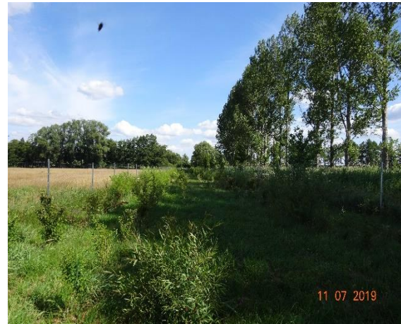
Landschaftshecke am Reglitzgraben