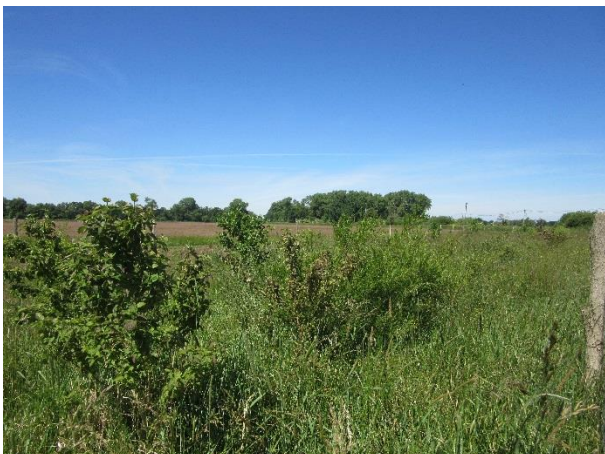
Im Vordergrund der Blutrote Hartriegel ( Cornus sanguinea )

Weiterführende Informationen können Sie bei Bedarf unter unten angegebener Adresse erhalten.