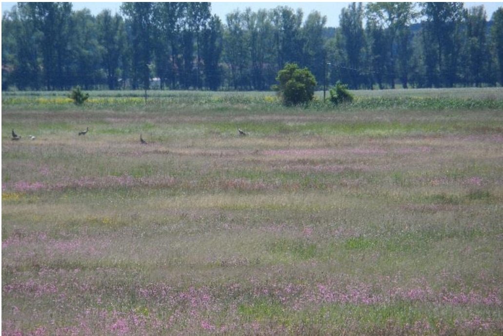
Langjährig extensiv genutztes Niedermoorgrünland im Flächenpool mit Kuckucks-Lichtnelken-Aspekt und Kranichfamilie im Juni