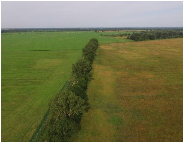
Rechts der Baumreihe Flächenpool mit Extensiv-Grünland; links davon Intensivgrünland