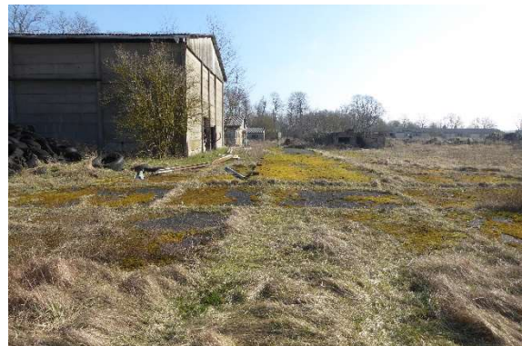
Abb. 2: Scheune westliche Seite

Weiterführende Informationen können Sie bei Bedarf unter unten angegebener Adresse erhalten.