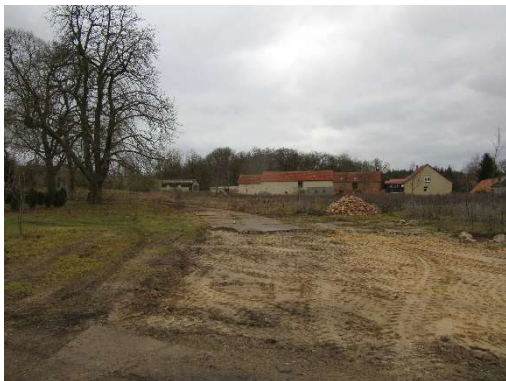
Abb. 1: östliche Seite