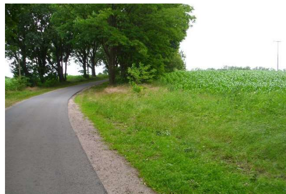
Abb. 2: Maisacker rechts