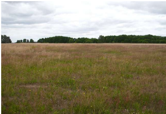
Abb. 1: Trockene Grünlandfläche