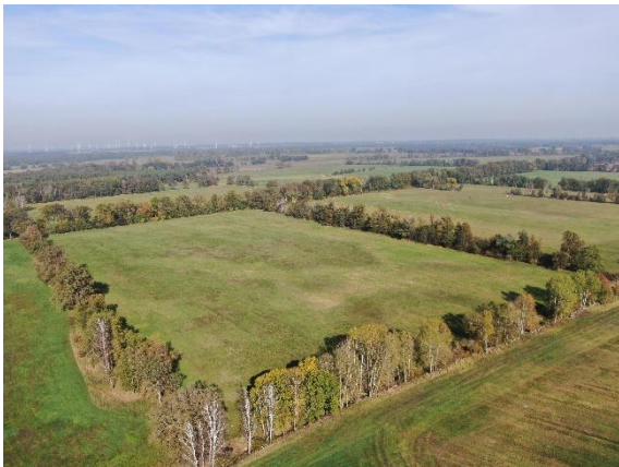
Abb. 1: Luftbild Oktober 2019