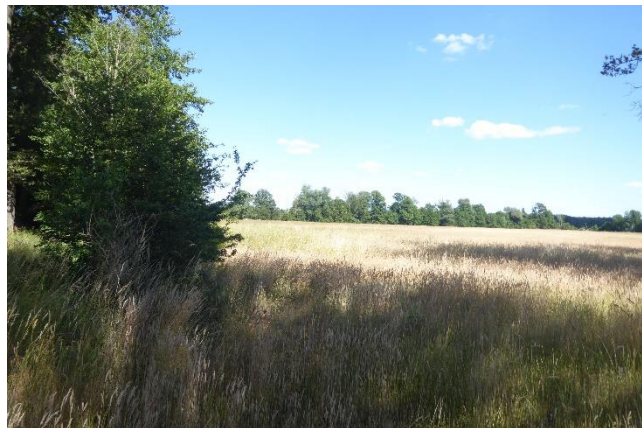
Abb. 2: Fläche Juni 2022