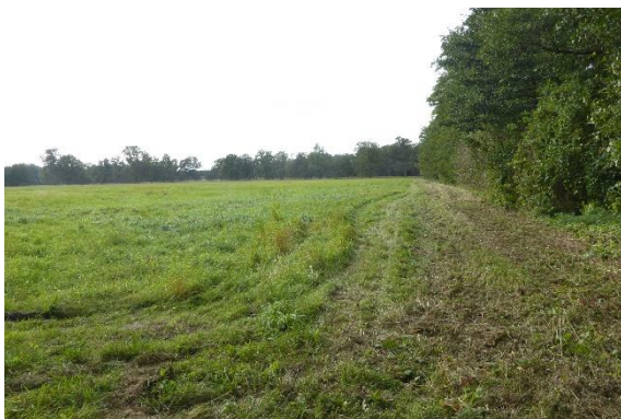
Abb. 3: Fläche Oktober 2023

Weiterführende Informationen können Sie bei Bedarf unter unten angegebener Adresse erhalten.