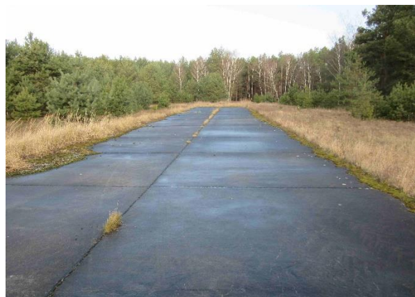
Abb. 1-6: Abbruch- und Entsiegelungsobjekte, für Artenschutz herzurichtender Bunker

Weiterführende Informationen können Sie bei Bedarf unter unten angegebener Adresse erhalten.