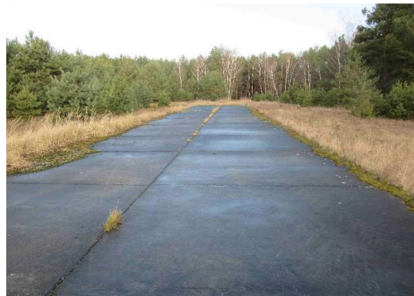
Abb. 1-6: Abbruch- und Entsiegelungsobjekte, für Artenschutz herzurichtender Bunker

Weiterführende Informationen können Sie bei Bedarf unter unten angegebener Adresse erhalten.