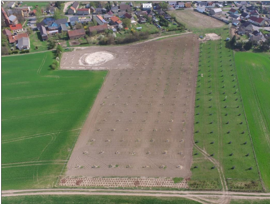
Abb. 1: Streuobstwiese Bochow mit erstem und zweitem Bauabschnitt (April 2017)

Im April 2017 ist ein Stall errichtet worden, der die Voraussetzung für eine Schafbeweidung mit Skudden möglich macht. In 2019 wurde die Fläche noch mit verschiedenen Habitatelementen für Zauneidechsen ergänzt.