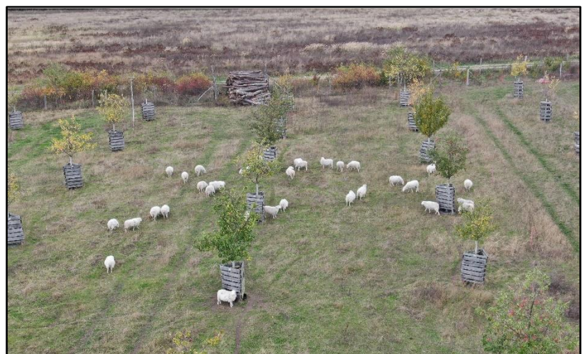
Abb. 3: Schafbeweidung Streuobstwiese Bochow (Oktober 2020)

Weiterführende Informationen können Sie bei Bedarf unter unten angegebener Adresse erhalten.