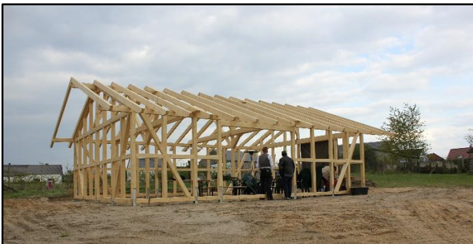
Abb. 2: Schafstall Streuobstwiese Bochow (April 2017)

Im April 2017 ist ein Stall errichtet worden, der die Voraussetzung für eine Schafbeweidung mit Skudden möglich macht. In 2019 wurde die Fläche noch mit verschiedenen Habitatelementen für Zauneidechsen ergänzt.