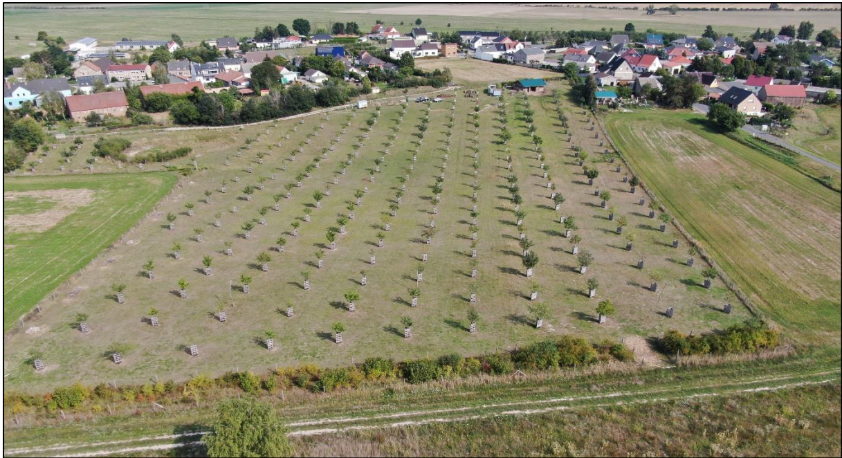
Abb. 1: Streuobstwiese Bochow (September 2022)

Im April 2017 ist ein Stall errichtet worden, der die Voraussetzung für eine Schafbeweidung mit Skudden möglich macht. In 2019 wurde die Fläche noch mit verschiedenen Habitatelementen für Zauneidechsen ergänzt.