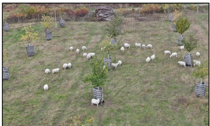
Abb. 3: Schafbeweidung Streuobstwiese Bochow (Oktober 2020)

Weiterführende Informationen können Sie bei Bedarf unter unten angegebener Adresse erhalten.