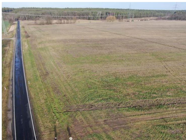
Abb. 2: Zustand der Ackerflächen im Westen des Pools an der Straße vor Maßnahmendurchführung

Weiterführende Informationen können Sie bei Bedarf unter unten angegebener Adresse erhalten.