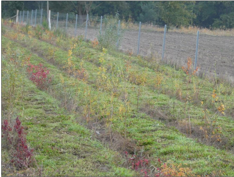
Abb. 5: Eine der im Winter 2020/2021 gepflanzten Hecken im Oktober 2021