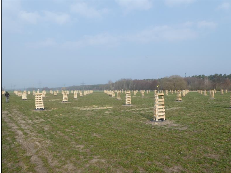
Abb. 3: Gesamteindruck der Streuobstwiese nach der Pflanzung im März 2021

Im Jahr 2021 wurden die Poolmaßnahmen nahezu vollständig durch die Pflanzung der Obstbäume auf der Streuobstwiese, die Pflanzung der Hecken und die Einsaat von Regiosaat auf den künftigen Grünlandflächen umgesetzt. Nur im Bereich der Streuobstwiese wurde auf die Einsaat von Regiosaatgut noch verzichtet, weil diese in der ersten Pflegeperiode noch zu viel befahren wird (Wässerung etc.).