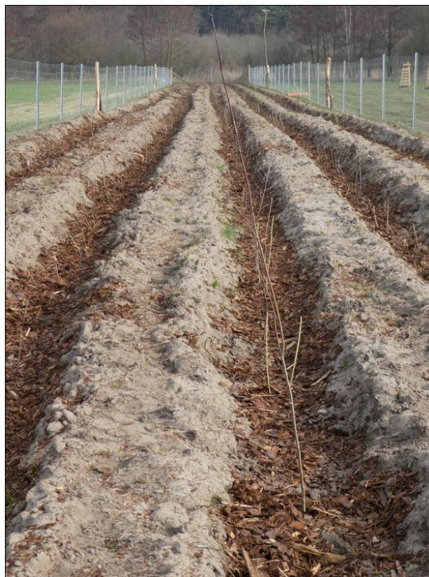
Abb. 4: Frisch gepflanzte Hecke im März 2021